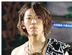
ジャニーズ事務所もソッポ向いた!? 来年“10周年”を迎えるKAT-TUNの