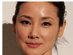
吉田羊のブレイクで仕事減の元宝塚女優