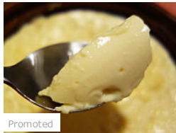
Promoted 土鍋でプリン作ってみたら。あらやだ！カンタン！おいしい！ (価格.com)