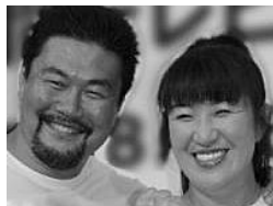
北斗晶の代理・佐々木健介が不評の一方でスポットが当たるあの女性タレ