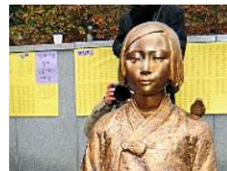
元慰安婦支援、少女像撤去が条件 政府、蒸し返し防止へ協議