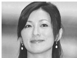
合コンまでしたのに…中田有紀の結婚発表にあのミュージシャンが嫉妬で