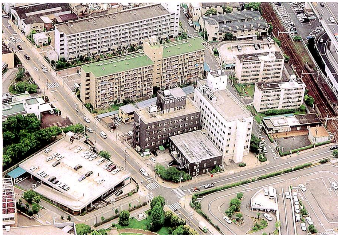
● 加島地区 ●