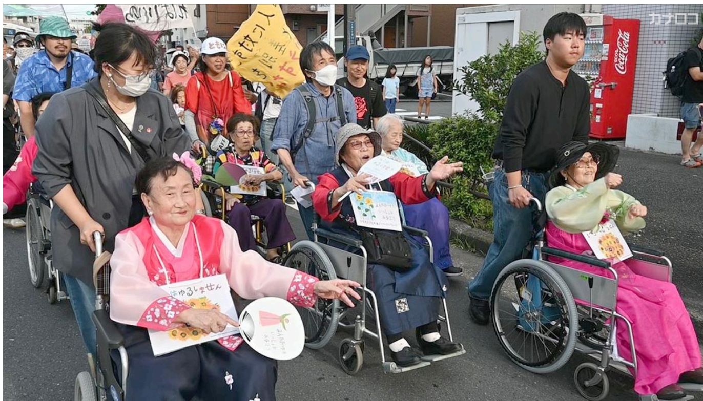
パレードを楽しみ、条例に守られていることを実感するハルモニたちは9月28日、川崎市川崎区

川崎市長選が26日、投開票される。市が抱える市民生活の課題を足元から見つめ、明日を考える。